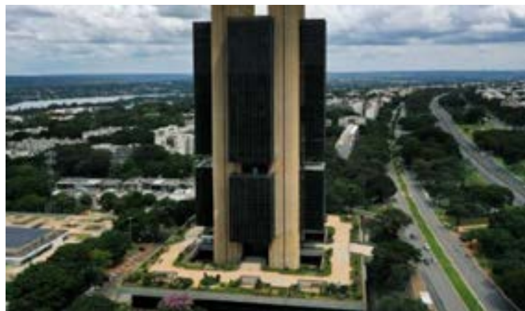
Economistas do BC defendem manutenção de juros para controle de inflação

Mesmo sob pressão, Selic deve ficar em 13,75% ao ano. É a mais alta do mundo