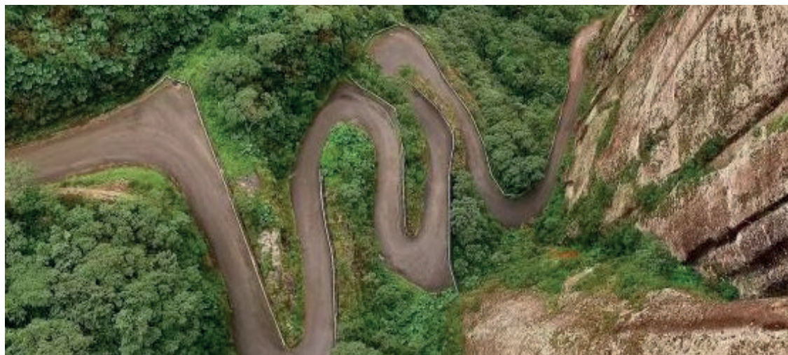
Serra do Corvo Branco

No momento, o trecho está bloqueado e passa pela última etapa de obras, após estragos causados por chuvas intensas. A liberação para os turistas está prevista para agosto.